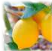
レモン果実エキス