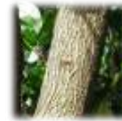
マグワ樹皮エキス