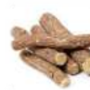
カンゾウ根エキス